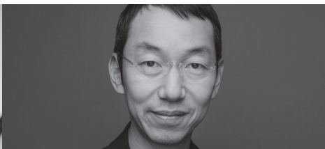
独立研究者・著述家・パブリックスピーカー 山口 周氏